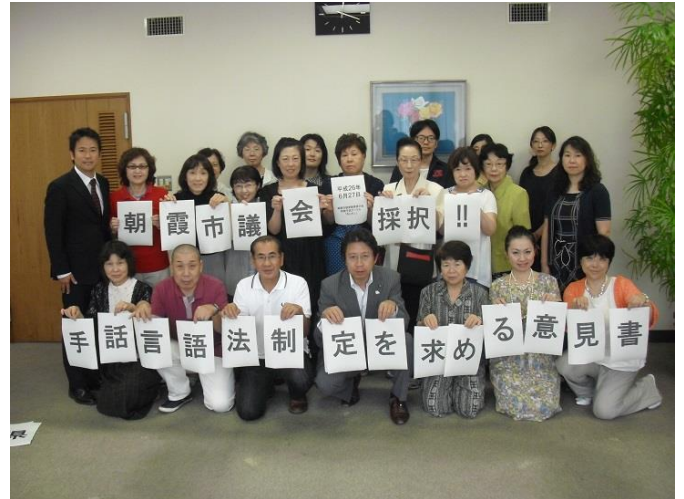
朝霞市聴覚障害者の会・あさか手話サークルあじさいのメンバーのみなさん。前列中央は、利根川仁志朝霞市議会議長